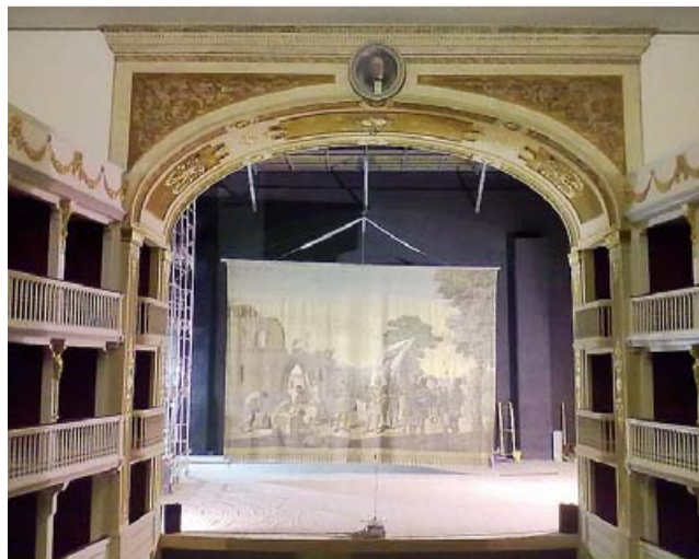
IL CANTIERE Il teatro Mercadante di Altamura